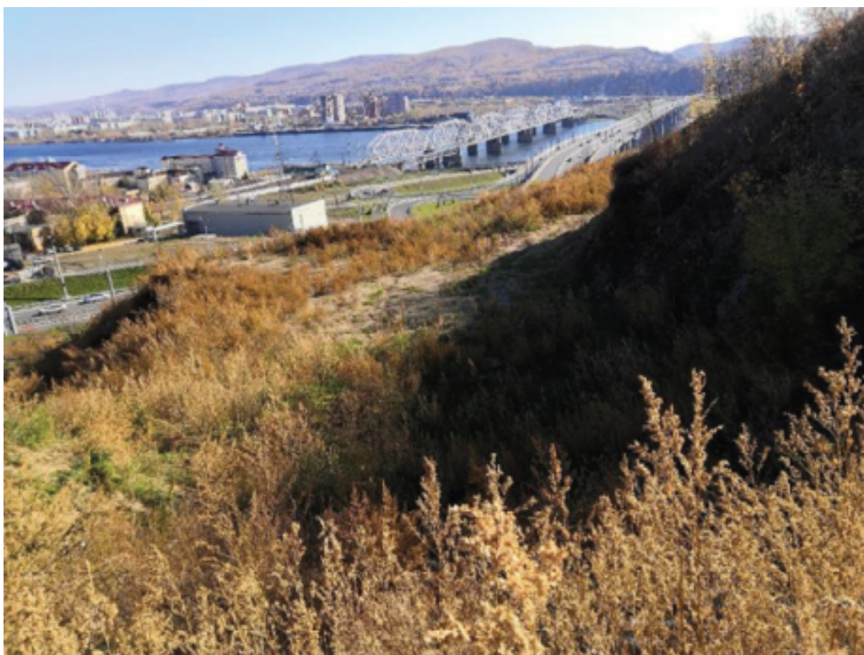
Площадка для жилого дома 6-8