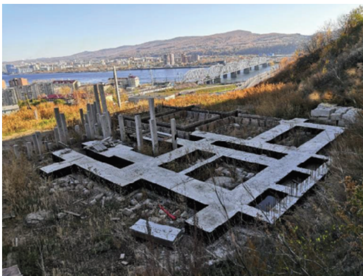
Жилой дом 6-7