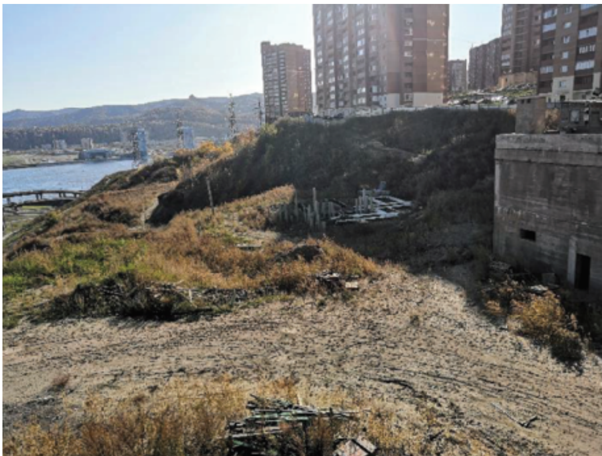
Временная дорога к дому 6-7