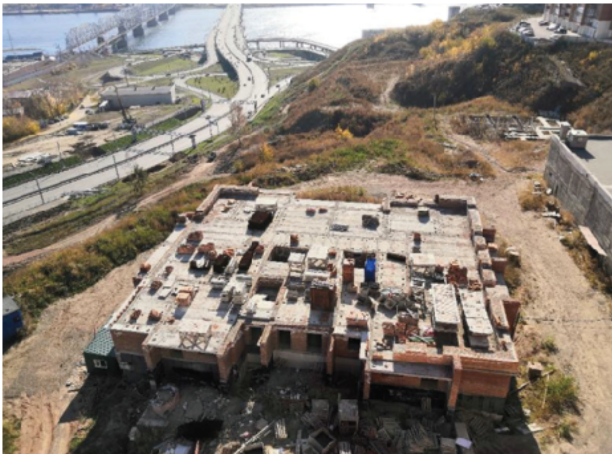
Жилой дом 6-6